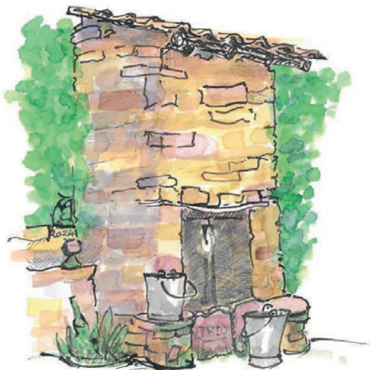
Der doppeltstücker Brunnen