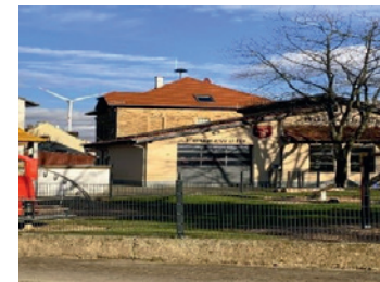
Bürger- und Feuerwehrhaus

Im Jahr 2011 erwirkte der Gemeinderat finanzielle Zuschüsse vom Land, Kreis und der Verbandsgemeinde Alzey-Land für den Bau des seit Jahren angestrebten Anbaus eines Bürgerhauses mit integriertem Feuerwehrhaus.